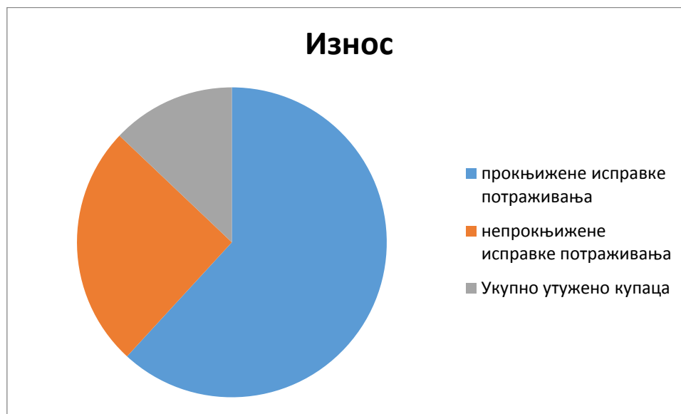
Графикон број 2: Однос исправке потраживања и утужења

утужења. Због неблаговремених утужења угрожен је део обртне имовине Предузећа коју чине потраживања од купаца, јер протоком времена наплата постаје неизвеснија.